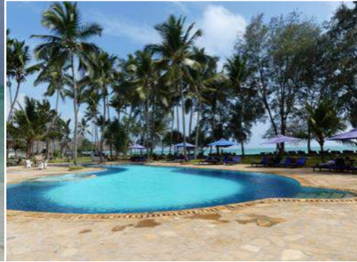
Bluebay Beach Resort