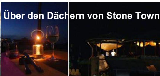
Über den Dächern von Stone Town