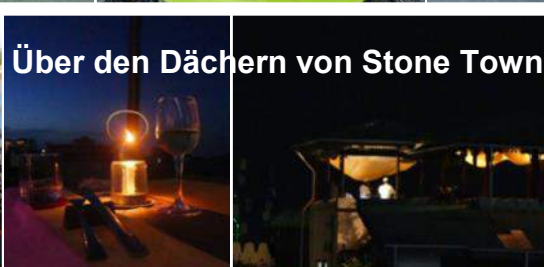
Über den Dächern von Stone Town